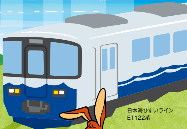
日本海ひすいライン ET122系