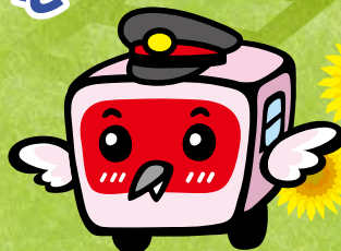
えちごトキめき鉄道マスコット トキテツくん