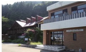
親不知交流センター

親不知の新鮮な魚介類が水揚げされます。マリンスポーツや釣りのスポットとしても人気です。