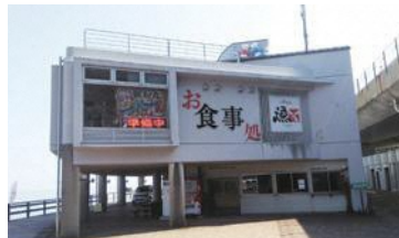
親不知/レストラン漁火