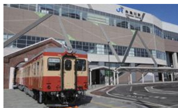
糸魚川ジオステーションジオパル

糸魚川の情報発信基地。観光情報の発信だけでなく鉄道の実車両や鉄道模型の展示・操作なども魅力的です！