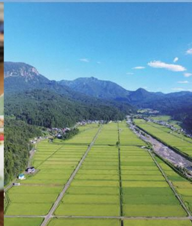
根知谷の田園風景

このモニターツアーは「新潟県ワーケーション体験プログラム実証事業」によるものです。