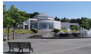
フォッサマグナミュージアム

ヒスイや化石・鉱物のほか、日本列島誕生の成り立ちが分かるシアターを鑑賞。驚きと感動の連続です！