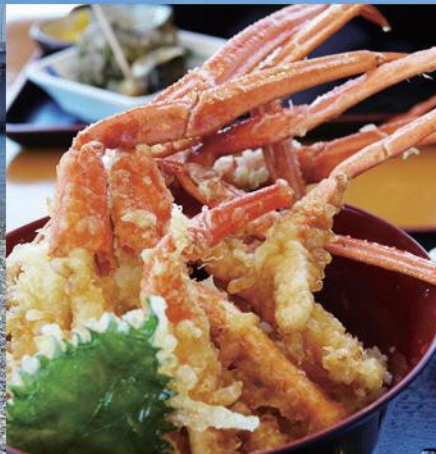
豪快「ベニズワイガニ天丼」