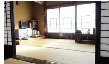
移住体験交流施設「水上」

米作りから酒作りまで一貫体制の酒蔵。蔵主が拘り抜いた貴重な日本酒を試飲（有料）。